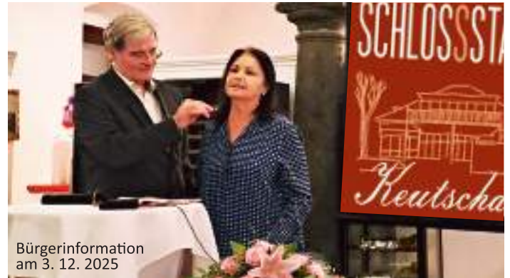
Bürgerinformation am 3. 12. 2025

Dass keine Verlängerung des Pachtvertrags zustande kam, sorgt in der Bevölkerung für Kopfschütteln. Viele Bürgerinnen und Bürger äußern offen ihre Meinung, dass die Situation wohl vermeidbar gewesen wäre, wenn der Bürgermeister etwas mehr Energie in konstruktive Gespräche und frühzeitige Lösungsansätze investiert hätte. Dass der Betrieb nun zum Jahresende schließen muss, erfüllt viele mit großem Bedauern. Zugleich bleibt die Hoffnung, dass der Bürgermeister rasch und vorausschauend an einer passenden Nachfolge arbeitet.