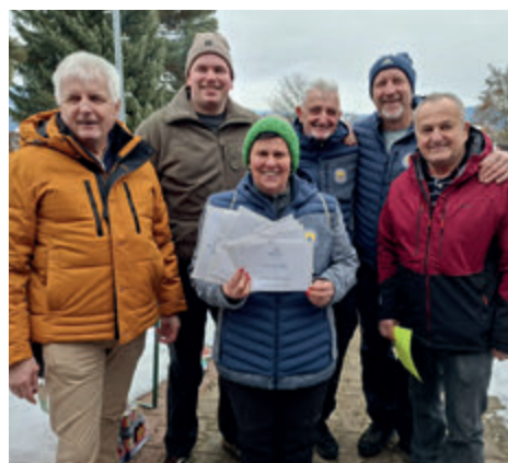
1. Platz: „Trixis Team“