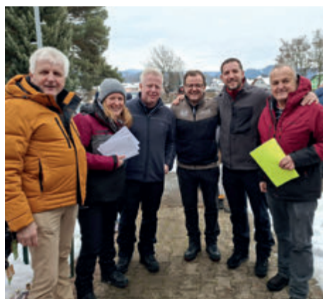
2. Platz: „GH Joas“