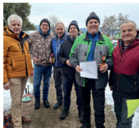
3. Platz: „Die Glücksbärlis“