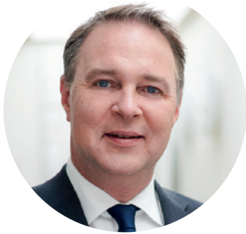
Vizekanzler Andi Babler

„Sozialdemokratie wirkt – die SPÖ hat in der Regierung jeden zweiten Tag eine wichtige Maßnahme für die Menschen in Österreich auf den Weg gebracht.“