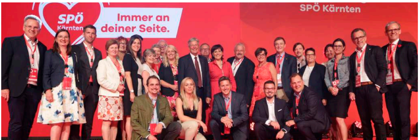
Die neugewählten Mitglieder des Landespartei Vorstandes der SPÖ Kärnten

IMPRESSUM: HERAUSGEBER, MEDIENINHABER und für den Inhalt verantwortlich: SPÖ Magdalensberg, OPV Andreas Scherwitzl, Sonnenblick 4, 9064 Timenitz ERSCHEINUNGsort: 9064 Magdalensberg