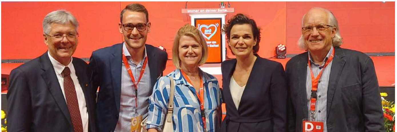
Treffen mit Landeshauptmann Peter Kaiser und der Bundesparteivorsitzenden Pamela Rendi-Wagner