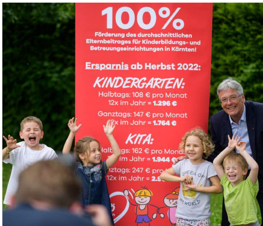
Landeshauptmann Peter Kaiser mit Kindern des KIGA Magdalensberg

übernommen. Für Magdalensberg bedeutet dies, dass der Besuch des Kindergartens und der Kita zukünftig kostenlos sein wird, lediglich für das Essen werden die Eltern € 75 pro Monat zu bezahlen haben.