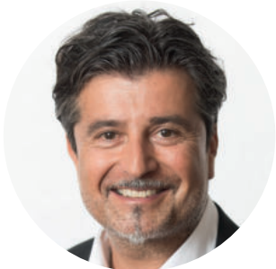
LAbg. Stefan Sandrieser

Ausschuss für BürgerInnenbeteiligung, direkte Demokratie und Petitionen Ausschuss für Kultur, Sport und Europa Ausschuss für Recht, Verfassung, Immunität, Volksgruppen und Bildung Ausschuss für Wasserwirtschaft, Öffentliches Wassergut und Hydrographie