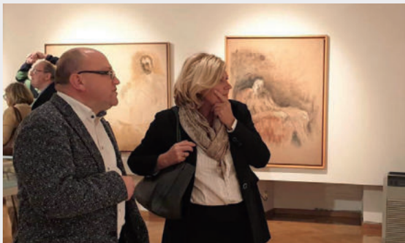
Aufbruchsstimmung: Die stadteigenen Galerien sind wieder geöffnet. Für Kunst- und Kulturinitiativen wurde ein Maßnahmenpaket geschnürt.

Subventionswerber, die Veranstaltungen absagen oder verschieben mussten, dürfen bereits entstandene Kosten abrechnen. Die stadteigenen Galerien und das Musilmuseum können bis Ende des Jahres gratis besucht werden!