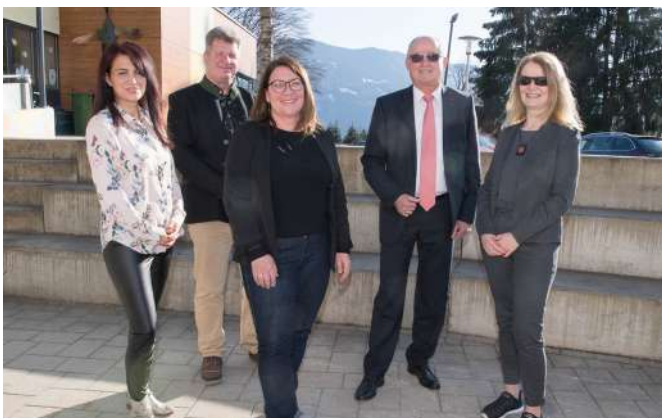
SPÖ-Mitglieder im Ausschuss für Bildung, Familien, Kultur, Soziales und Generationen