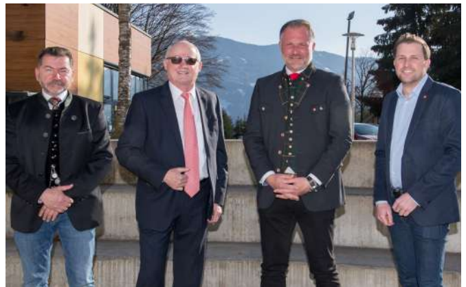
Das SPÖ Gemeindevorstandsteam