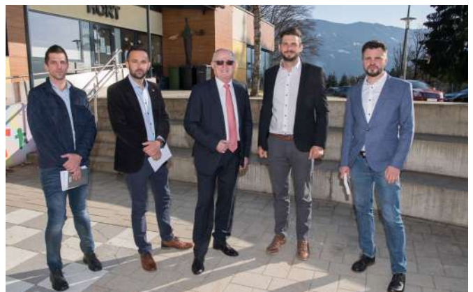
SPÖ-Mitglieder im Ausschuss für Infrastruktur, Landwirtschaft, Umwelt, Feuerwehrwesen und Raumordnung