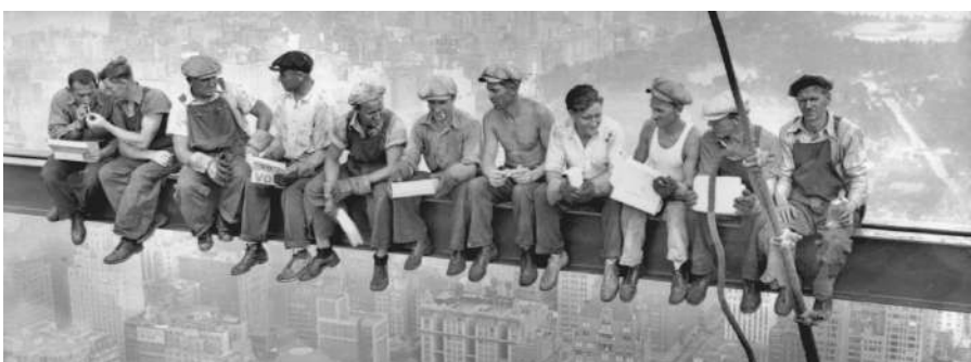
Lunch atop a Skyscraper, 1932

SPÖ – Deine Sozialdemokratische Partei Österreichs