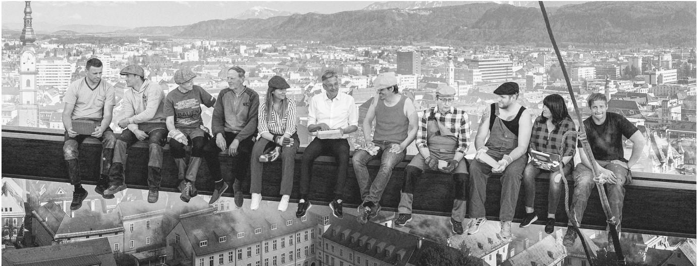
„Jausnen am Dach“, 2022

W ir sind die, die Fundamente gießen, Kinder unterrichten, Bettwäsche wechseln und an Fließbändern stehen. Wir sind die, die Hausaufgaben machen, Abendessen kochen und Rechnungen zahlen. Wir sind die Nachtschicht und der Wochenenddienst. Wir sind die Gehetzten und die Erblosen, die Schuldner und Ratenzahler.