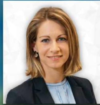
Silke Sommer Vizebürgermeisterin