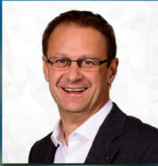
Helmut Ogris Bürgermeister