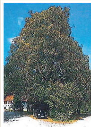
Sommer-Linde, vlg. Maurautschnig, in Bodensdorf, etwa 300 Jahre alt