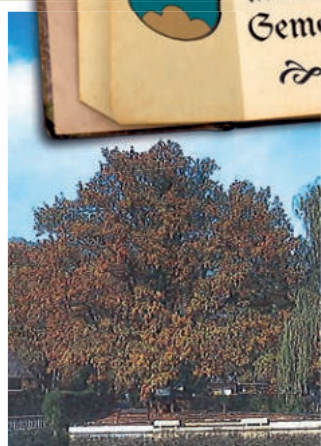
Eiche, Strandbad Laggner, Steindorf, etwa 100 Jahre alt