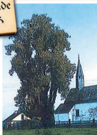
Sommer-Linde (Kirchenlinde), neben dem Kirchlein St. Margarethen in Tiffen, 300 bis 400 Jahre