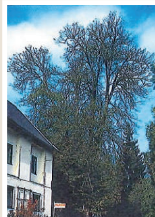
Winter-Linde (Dorflinde), beim Kaufhaus zur Linde, Steindorf, über 200 Jahre alt