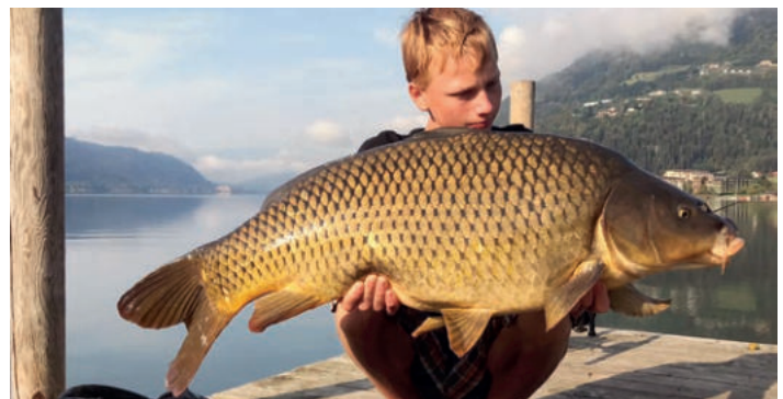
Ein begeisterter Jungfischer