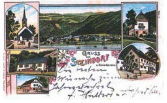
Postkarte von Steindorf im Jahre 1899