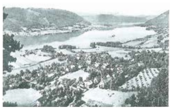
Steindorf und der Ossiacher See im Jahre 1912