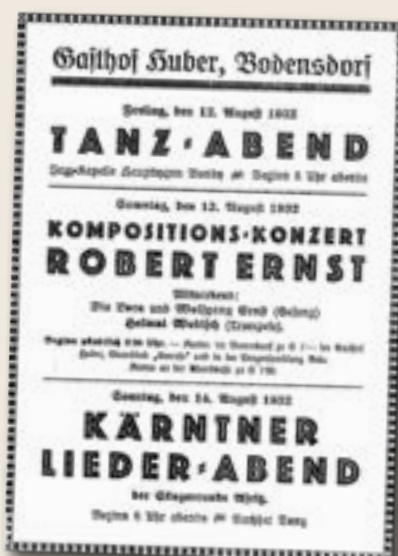
Plakat aus dem Jahre 1932