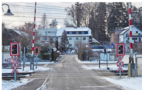
EK Kochstraße soll laut ÖBB als einzige offen bleiben