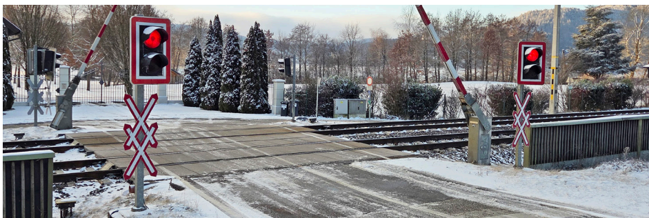
EK Gut Walterskirchen: Laut ÖBB Schließung langfristig angedacht

und Notarzt in den Süden Krumpendorfs. Also eine Unterführung im Osten und eine im Westen des Ortes.