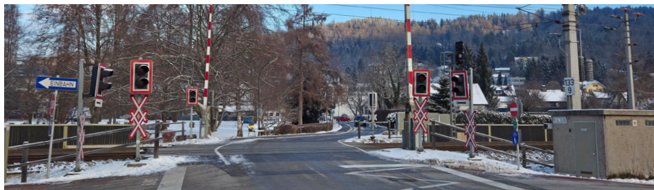
EK Schlossallee soll laut ÖBB für Kraftfahrzeuge geschlossen werden, wie Bad-Stich-Straße