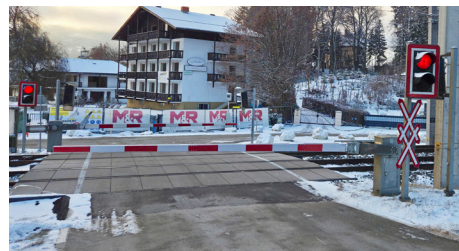
EK Kropfitschbad: Laut ÖBB Schließung langfristig angedacht